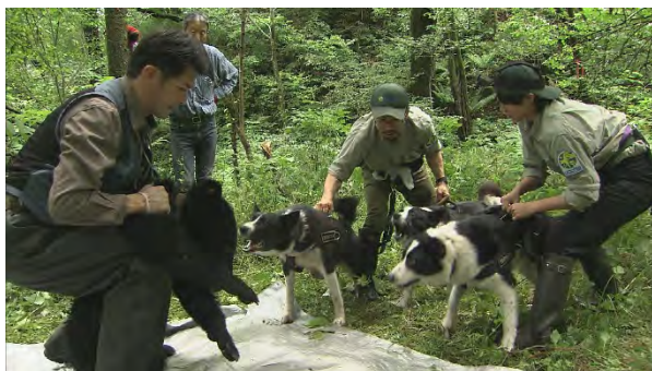
クマに吠える親子のベアドッグ